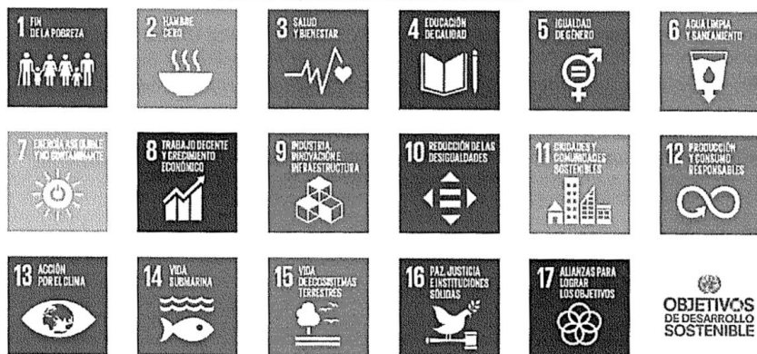
Gráfico 1. Objetivos del Desarrollo Sostenible